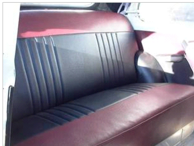
Bagsæde i en Opel Olympia '54 cabriolet